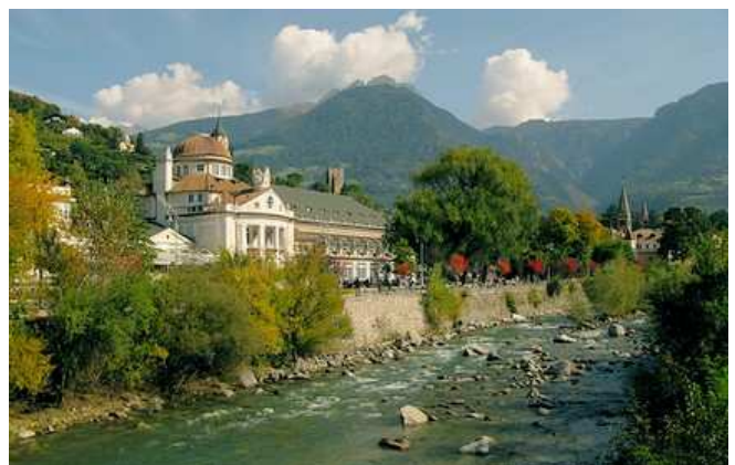
Terme di Merano sul fiume Passiria

Questa risposta da parte dei soci, oltre che motivo d'orgoglio per le scelte del Consiglio Direttivo, sarà anche prezioso spunto di riflessione per il programma di cicloescursioni del prossimo 2012, per il quale aspettiamo anche i vostri suggerimenti.