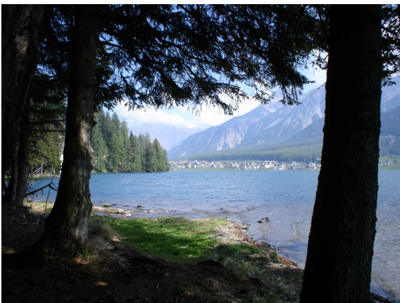
Lago di S.Valentino alla Muta

Declinazione tutta Italiana anche per la ciclovacanza di Agosto: per celebrare il 150° anniversario dell'Unità d'Italia , dopo la bella ciclovacanza sulla ciclabile della Riviera di Ponente (San Remo-San Lorenzo) avrà luogo quella dedicata alla Ciclovia della Val Venosta (Resia-Merano), che vedrà i nostri soci pedalare tra i meleti ai piedi del "Piccolo Tibet", ovvero l'imponente massiccio dell'Ortles Cevedale e lungo il fiume Adige. Non ci aspettavamo una risposta così entusiasta: già a Marzo tutti i posti erano prenotati!