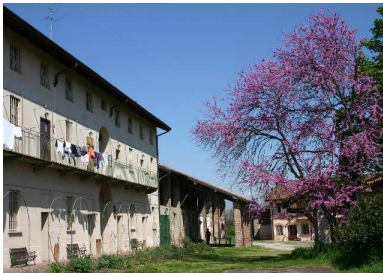
Cascina Santa Brera