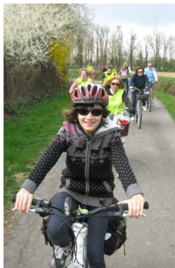
A sinistra: Pedalando tra Settala e Paullo sulla via del Ritorno.

Giunti all'Oasi ci siamo lasciati rapire da atmosfera agresti , inebriati dalle fioriture di primavera e rallegrati dallo starnazzare delle oche, dal goglottare dei tacchini in amore e dal chiocciare delle galline. Un paradiso così vicino merita di essere conosciuto e frequentato. Andateci, o, ancora meglio, veniteci con noi, perché ci torneremo!