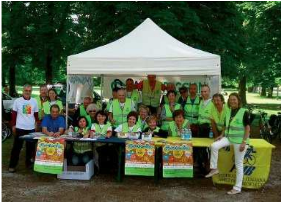
L'associazione Bicinsieme di Parma

Gli amici di Bicinsieme , associazione FIAB di Parma, ci ospiteranno in un fine settimana di sapore emiliano e ci guideranno alla scoperta di Parma, Torrechiara e della reggia di Colorno . A fine Settembre saranno invece nostri ospiti nell'escursione a Villa Barni di Roncadello . La sezione mountain bike, amante della sorpresa, svelerà di volta in volta le mete settimanali del gruppo. Mete sempre diverse, divertenti e avventurose!