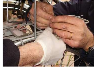
Mani esperte per la messa a punto di inizio stagione

Apertura della stagione in bellezza con Bici Sicura! La nostra tradizionale manifestazione d'esordio ha richiamato numerosi soci e non soci per la messa a punto gratuita della bici, a cura degli esperti volontari di Paullo che Pedala-FIAB. E alla fine un brindisi!